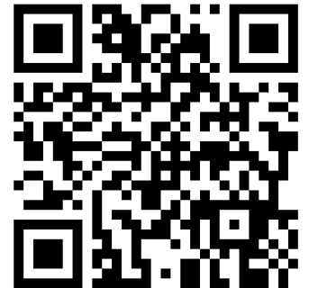
TABELA DE MEDIDAS